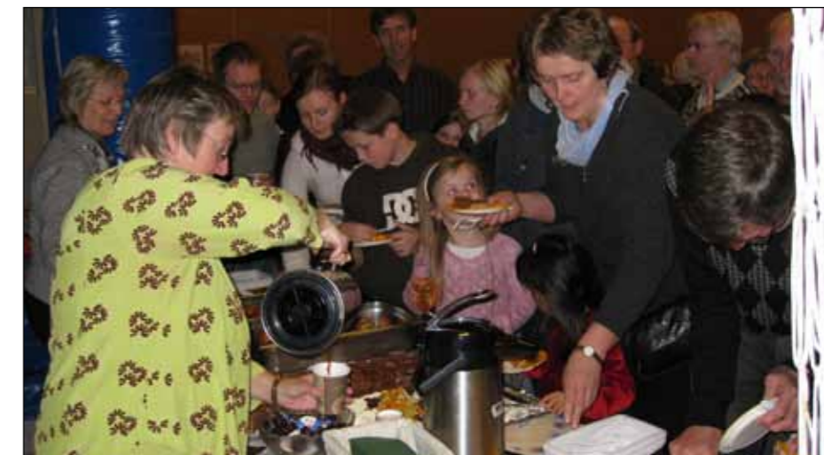
Kafé: Det var kaffi og kaker til alle.