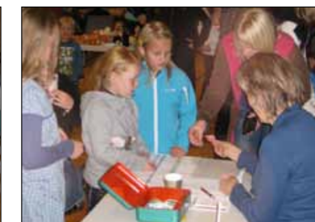
Åresal: Mange kjøpte årar.