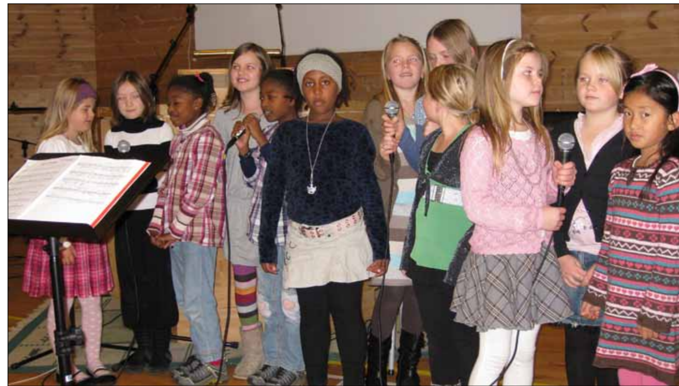
Barnesang: Barnegospelkoret Shine song friskt om Jesus.